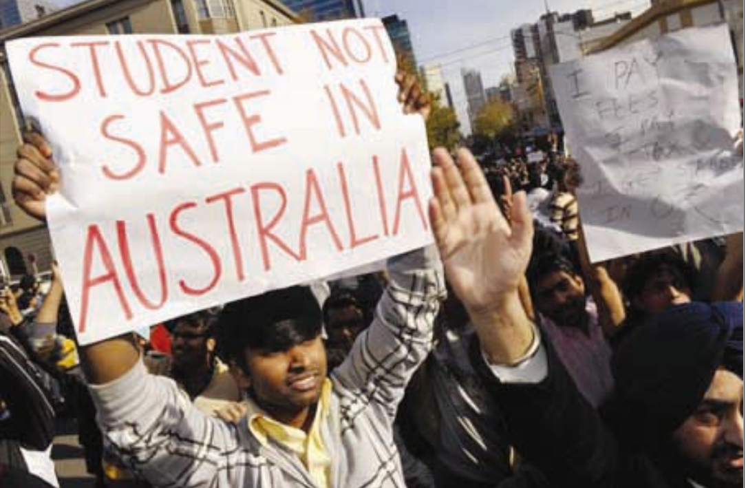
വാംഗീയ ആക്രമണങ്ങൾ സംബന്ധിച്ച് അന്വേഷണം വേണമെന്ന് ആവിശ്യപ്പെട്ട് ഇന്ത്യൻ വിദ്യാർത്ഥികൾ മെൽബണിൽ നടത്തിയ പ്രതിഷേധ റാലിയിൽനിന്നും..