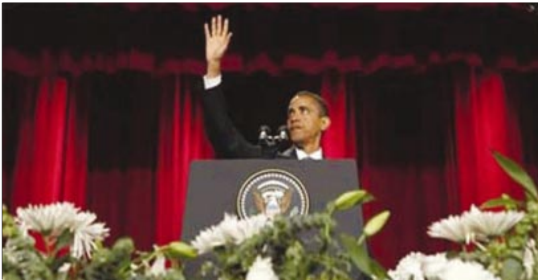
കെയ്റോ സർവ്വകലാശാലയിൽ ബരാക് ഒബാമ പ്രസംഗിക്കുന്നു.

ഈജിപ്ത്: അമേരിക്കയ്ക്കും മുസ്ലീം ലോകത്തിനും ഇടയിലുള്ള സംശയങ്ങളും അസ്വസ്ഥതകളും അവസാനിപ്പിച്ച് സൗഹൃദത്തിന്റേതായ പുതിയൊരു തുടക്കം കുറിക്കണമെന്നും അമേരിക്കയും മുസ്ലീം ലോകവും ഒന്നിച്ചു നിന്ന് ഭീകരതയെ എതിരിടണമെന്നും ബരാക് ഒബാമ മുസ്ലീം സമൂഹത്തെ ആഹ്വാനം ചെയ്തു.