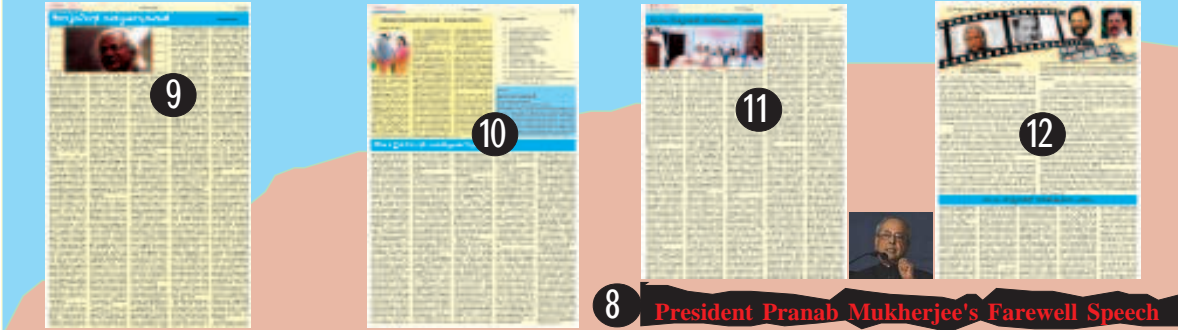
8 President Pranab Mukherjee's Farewell Speech

Tel: 267-991-2111 e-mail: timesofamerica@yahoo.com