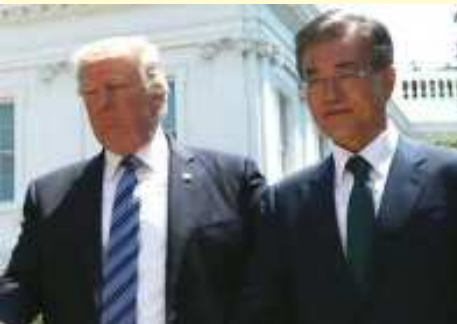
വാഷിംഗ്ടൺ: വിലക്കുകൾ ലംഘിച്ച് തുടർച്ചയായി ആണവ മിസൈൽ പരീക്ഷണങ്ങൾ നടത്തുന്ന ഉത്തര

കൊറിയയ്ക്ക് ശക്തമായ താക്കീതമായി പ്രസിഡന്റ്. ക്ഷമയുടെ കാലം കഴിഞ്ഞുവെന്നും മനുഷ്യത്വത്തിന് വില കല്പിക്കാത്ത കിരാത ഭരണകൂടത്തിന്മേൽ കൂടുതൽ ഉപരോധം ചുമത്തുമെന്നും ട്രംപ് മുന്നറിയിപ്പ് നല്കി. വൈറ്റ് ഹൗസിൽ ദക്ഷിണ കൊറിയൻ പ്രസിഡന്റ് മുൺ ജെ ഇന്നുമായി നടത്തിയ കുടിക്കാഴ്ചക്കു ശേഷമായിരുന്നു ട്രംപിന്റെ പ്രസ്താവന.