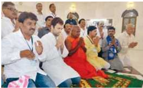
രാഹുൽ ഗാന്ധി അംബേദ്കർ സമാധിയിൽ

ന്യൂഡൽഹി: ഭരണഘടനാ ശിൽപിയായ ബി.ആർ അംബേദ്കറുടെ 125-ാം ജന്മദിനം വിപുലമായി ആഘോഷിക്കാൻ കേന്ദ്രസർക്കാർ തീരുമാനിച്ചു.