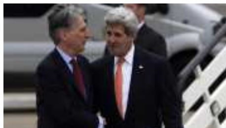
ബ്രിട്ടീഷ് വിദേശകാര്യസെക്രട്ടറി ഫിലിപ്പ് ഹാമൺഡ് സ്റ്റേറ്റ് സെക്രട്ടറിയുമായി ഇറാൻ ആണവപര്യടനത്തിൽ പങ്കെടുക്കുന്നു.