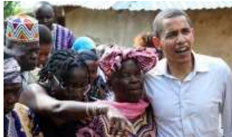
പ്രസിഡന്റ് ഒബാമ കെനിയയിലെ പീറ്റാർവിലെ കെനിയൻ സന്ദർശിച്ചത്. 92ലായിരുന്നു ബോമ മിഷണറിയുടെ സന്ദർശനം.

വാഷിംഗ്ടൺ: ഔദ്യോഗിക പദവിയിലിരിക്കെ പ്രസിഡന്റ് ബരാക്ക് ഒബാമ ആദ്യമായി പിതൃനഗരം സന്ദർശിക്കുവാൻ തയ്യാറെടുക്കുന്നു. ജൂലൈയിലാണ് സന്ദർശനം. സെനറ്റർ ആയിരുന്നപ്പോൾ മൂന്നുതവണ ബോമ കെനിയ സന്ദർശിച്ചിട്ടുണ്ട്.