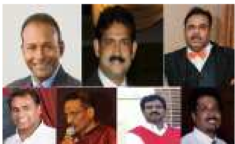
സന്തോഷി ഒരു പ്രാർത്ഥനാ മന്ദിരം എന്ന ലക്ഷ്യത്തിലേക്കു നീങ്ങുന്നതിന്റെ മുന്നോടിയായി ഈ വിഷുവിനു കെഎച്ച്എസ്എഫ് ഒരുക്കുന്ന 'സോളിഡ് ഫ്യൂഷൻ ടെംപ്ലോഷൻ' എന്ന പരിപാടി ഏപ്രിൽ 17നു വൈകുന്നേരം ആറിനു നടത്തുന്നു. മലയാളികളുടെ ഗായിക