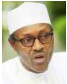
ലാഗോസ്: നൈജീരിയൻ പ്രസിഡന്റ് തെരഞ്ഞെടുപ്പിൽ ഗുഡ്ലക് ജോനാഥനെ പരാജയപ്പെടുത്തി പ്രതിപ

ക്ഷ ഓൾ പ്രോഗ്രസിവ് പാർട്ടി (എപിസി) നേതാവും മുൻ സൈനിക ഭരണാധികാരിയുമായ ജനറൽ മുഹമ്മദ് ബുഹാരി വിജയിച്ചു. ജനറൽ ബുഹാരിക്ക് 151 ലക്ഷം വോട്ടുകൾ ലഭിച്ചപ്പോൾ നിലവിലുള്ള പ്രസിഡന്റ് ജോനാഥൻ 117ലക്ഷം വോട്ടു മാത്രമേ കിട്ടിയുള്ളൂ. ജോനാഥന്റെ ഭരണകാലം അഴിമതിയും ബോക്കോഹറാമിന്റെ ആക്രമണവും മൂലം ഏറെ കലുഷിതമായിരുന്നു. ആദ്യമായാണ് നിലവിലുള്ള പ്രസിഡന്റ് തെരഞ്ഞെടുപ്പിൽ തോൽവി നേരിടുന്നത്. ജോനാഥന്റെ പ്രോഗ്രസിവ്