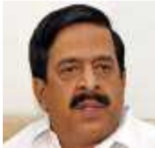
കോട്ടയം: സോളാർ കേസിലെ ഗുഡാലോചനയെക്കുറിച്ച് അന്വേഷിക്കണമെന്നു കഴിഞ്ഞ ദിവസം ചേർന്ന യുഡിഎഫ് യോഗം സർക്കാരിനോടു ആവശ്യപ്പെട്ടിരുന്നു.

റിച്ച് അന്വേഷിക്കണമോയെന്ന കാര്യത്തിൽ സർക്കാർ ആലോചിച്ചു തീരുമാനമെടുക്കുമെന്ന് ആഭ്യന്തര മന്ത്രി രമേശ് ചെന്നിത്തല. കോട്ടയത്തു മാധ്യമപ്രവർത്തകരോടു സംസാരിക്കുകയായിരുന്നു അദ്ദേഹം. ഗുഡാലോചനയെക്കുറിച്ച് അന്വേഷിക്കണമെന്നു കഴിഞ്ഞ ദിവസം ചേർന്ന യുഡിഎഫ് യോഗം സർക്കാരിനോടു ആവശ്യപ്പെട്ടിരുന്നു.