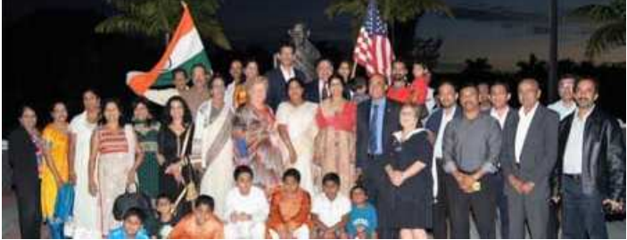
ഡേവിയിലുള്ള മഹാത്മാഗാന്ധി സ്കൂളിൽ ഇന്ത്യൻ ഓവർസീസ് കോൺഗ്രസ് ഫ്ളോഗറിൽ ചാപ്റ്ററിന്റെ നേതൃത്വത്തിൽ നടന്ന 67-ാമത് റിപ്പബ്ലിക് ദിനാഘോഷത്തിൽ നിന്നും

ട്ടിക്കുള്ളിലും അവരെ ഒറ്റപ്പെടുത്തിയ സാഹചര്യത്തിലാണ് മെർക്കലിന്റെ പ്രതികരണം.