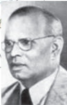
അദ്ദേഹത്തിന്റെ ധീരതയും സാമന്തത്വം നിഗമനങ്ങളുമെത്തിണങ്ങിയ ഒന്നാകിട മസ്തിഷ്കശേഷിയോടൊപ്പം ഭാവിയകൃത്യമായി നിരീക്ഷിക്കുവാൻ കഴിയുന്നു. കഠിനമായ കണ്ണി എന്നു ഞാൻ വിശേഷിപ്പിക്കുന്ന അപൂർവ്വമായ കഴിവ്. മൂന്നാമത്തേത് അദ്ദേഹത്തിന്റെ കായികശേഷി, പല മണിക്കൂറുകൾ തുടർച്ചയായി ജോലി ചെയ്യുവാനുള്ള ശാരീരികശേഷിയോടൊപ്പം ആഹ്ലാദപൂർണ്ണമായ മനോഭാവവും ആകർഷകമായ സർമരസികത്വവും.

മേനോന്റെ സമയോചിതമായ ഈ ഇടപെടൽ മൂലമാണ് ആ സൈനിക നടപടി വിജയകരമായി പൂർത്തിയാക്കാൻ കഴിഞ്ഞത്. ജോയ്പൂർ മഹാരാജാവ് പാക്കിസ്ഥാനിൽ ചേരുമെന്ന് ഭീഷണിപ്പെടുത്തി. മാത്രമല്ല, മേനോനെ വെടിവയ്ക്കുവാൻ തോക്കു ചൂണ്ടുകവരെ ചെയ്തു. വളരെ