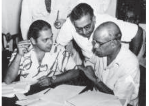
വി.പി.മേനോൻ ഗാന്ധിയർ മഹാരാജയുമൊത്ത് ഇന്ത്യയുമായി ചേരുന്ന ഇടവടി ഒപ്പുവെച്ചപ്പോൾ

യെടുക്കുന്നതിൽ സർദാറിന് അസാമാന്യമായ കഴിവുണ്ടായിരുന്നു. അങ്ങനെ രാഷ്ട്രീയ നേതൃത്വവും ഉദ്യോഗസ്ഥരും ഒറ്റ കീഴായി പ്രവർത്തിച്ചുതുടങ്ങി. നയം തീരുമാനിച്ചുകഴിഞ്ഞാൽ സർദാർ അതിന്റെ നിർവ്വഹണത്തിൽ അനാവശ്യമായി ഇടപെട്ടിരുന്നില്ല. അദ്ദേഹത്തെ നിശ്ചിതലക്ഷ്യത്തിലെത്തിക്കുന്നതിനുള്ള ഡ്രൈവറപ്പോലെയായിരുന്നു ഞാൻ. അദ്ദേഹമാകട്ടെ, ബാക്സീറ്റ് ഡ്രൈവിംഗ് നടത്താതെ, എന്റെ പൂർണ്ണമായി വിശ്വസിച്ചു. ഞാൻ അദ്ദേഹത്തെ രാവിലെയും വൈകുന്നേരവും വിവരങ്ങളറിയിച്ചിരുന്നു. പ്രധാന തീരുമാനങ്ങളിലെല്ലാം അദ്ദേഹത്തിന്റെ ഉപദേശം തേടുകയും ചെയ്തിരുന്നു. മറ്റൊരാൾ അദ്ദേഹം എനിക്കു വിട്ടുതരികയും ചെയ്തു.'