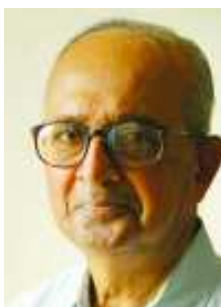
ന്യൂഡൽഹി: പ്രമുഖ പത്രപ്രവർത്തകൻ ബി.ജി.വർഗീസ് ഡിസംബർ 30 ചൊവ്വാഴ്ച അന്തരിച്ചു.

1986 മുതൽ സെന്റർ ഫോർ പോളിസി റിസർച്ചിന്റെ അമരക്കാരനായിരുന്നു. ഇന്ദിരാഗാന്ധിയുടെ അടുത്ത മിത്രമായിരുന്ന ശേഷം അവരെ എതിർത്തു ജോലി രാജിവച്ച ശ്രദ്ധേയ വ്യക്തിത്വമാണ് അന്തരിച്ച ബി.ജി. വർഗീസ്. ഇന്ദിരാഗാന്ധിയുടെ പ്രസ് സെക്രട്ടറി ആയിരിക്കേ പ്രധാനമന്ത്രിക്കു പ്രസംഗങ്ങൾ എഴുതി നൽകിയിരുന്നത് വർഗീസായിരുന്നു. ഇന്ദിരാഗാന്ധിയോട് ഏറെ അപ്പോഹം നിലനിർത്തിയ അദ്ദേഹം സിക്ലിമിൻ ഇന്ത്യയോടു ചേർത്തതിനെ വിമർശിച്ചതിന്റെ പേരിൽ ജോലി രാജിവച്ചുകൊണ്ടിരുന്നു. കമ്മ്യൂണിസം, ഇതാ വരുന്നു ഞങ്ങൾ എന്ന് പേരിൽ ഹിന്ദുസ്ഥാൻ ടൈംസിൽ എഴുതിയ മുഖപ്രസംഗമാണു ഇന്ദിരയുടെ അനിഷ്ടത്തിനു കാരണമായത്. അടിയന്തരാവസ്ഥയ്ക്കു ശേഷം 1977ലെ തിരഞ്ഞെടുപ്പിൽ മാവേലിക്കരയിൽ നിന്നു ലോക്സഭയിലേക്കു ഇടതുപക്ഷ സംയുക്ത സന്ദേശത്തിൽ മത്സരിച്ചെങ്കിലും പരാജയപ്പെട്ടു. 1975ൽ പത്രപ്രവർത്തനത്തിനുള്ള മാഗ്സസെ അവാർഡ് ലഭിച്ചു. കോമൺവെൽത്ത് ഹ്യൂമൻ റൈറ്റ് ഇനീഷ്യേറ്റീവിന്റെ അധ്യക്ഷൻ, എഡിറ്റോഴ്സ് ഗിൽഡ് ഓഫ് ഇന്ത്യ അംഗം എന്നീ നിലകളിലും പ്രവർത്തിച്ചു. പാർലമെന്റിൽ വച്ചു കാർഗിൽ വിദ്യ കമ്മിറ്റി റിപ്പോർട്ടു തയ്യാറാക്കി. 2002ൽ ഗുജറാത്ത് കലാപത്തിനു ശേഷം എഡിറ്റോഴ്സ് ഗിൽഡ് ഓഫ് ഇന്ത്യയുടെ നേതൃത്വത്തിലെ ഗുജറാത്ത് ഫാക്ട് ഫൈൻഡിംഗ് മിഷനിലെ അംഗമായിരുന്നു.