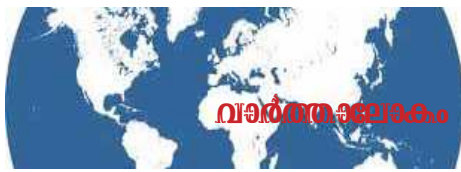
വർഷംകൊണ്ടു വരുന്ന സാക്ഷാത്കാരം